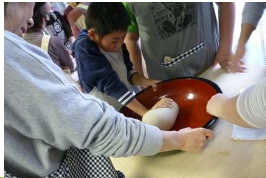
ごすけ手打ちラーメン体験